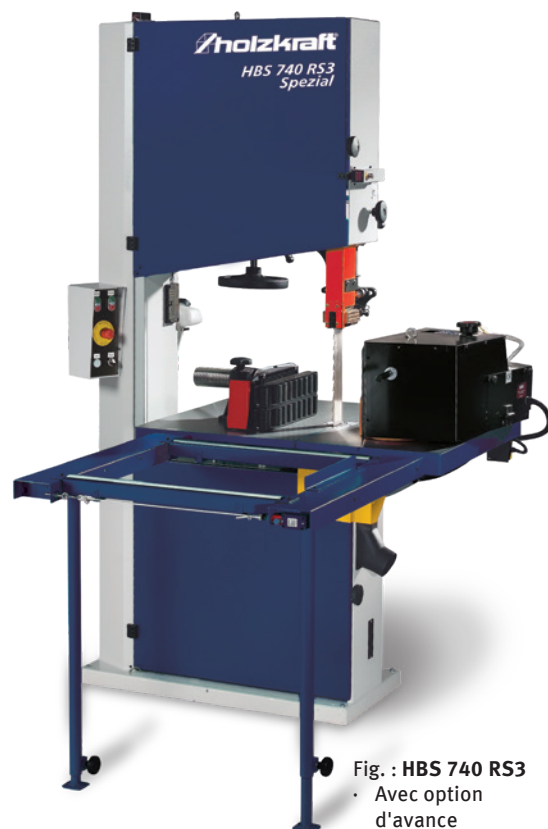
Fig. : HBS 740 RS3 • Avec option d'avance (515 2421)