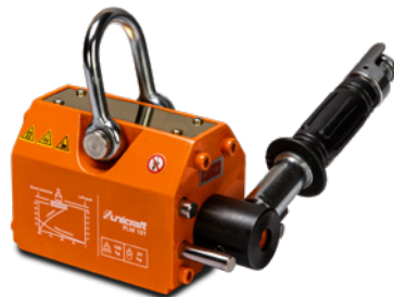
Fig. : PLM 101