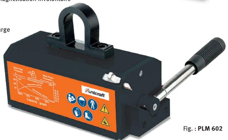
Fig. : PLM 602