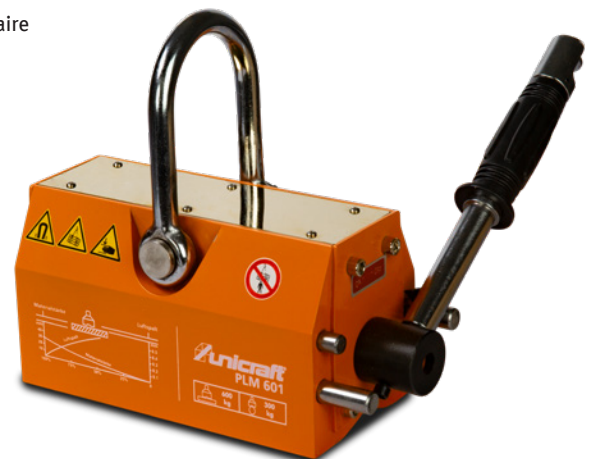
Fig. : PLM 601