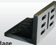
Fig. : Equerre de bridage