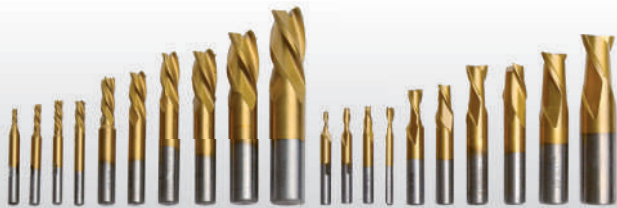
Fig. : Jeu de 20 fraises HSS Tin