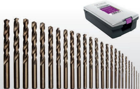
Fig. : Coffret de forets HSS-CO 5%