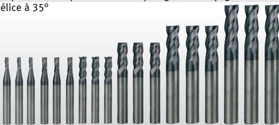
Fig. : Jeu de 18 fraises Pro