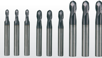
Fig. : Jeu de 9 fraises hémisphériques Pro