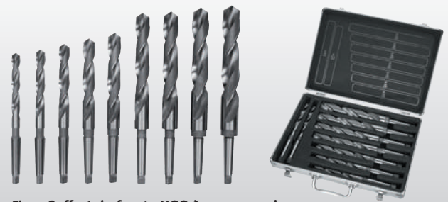
Fig. : Coffret de forets HSS à queue conique