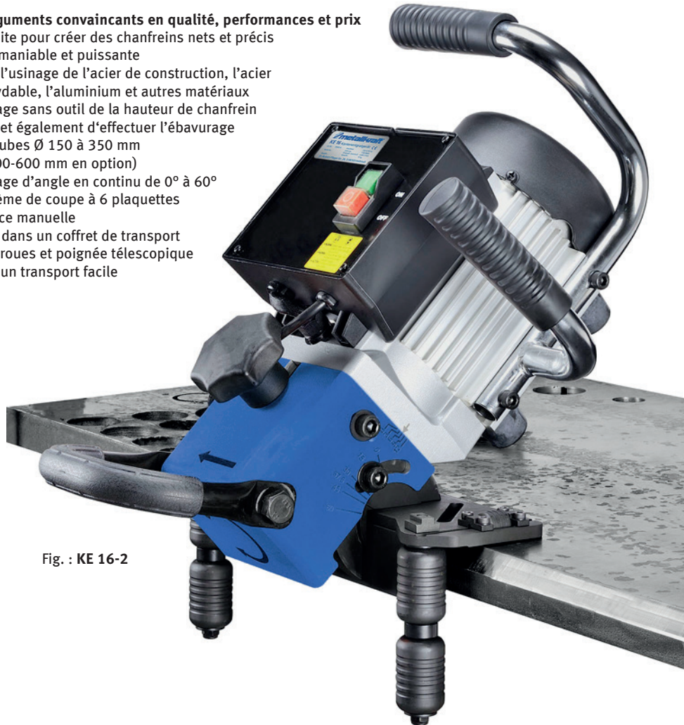
Fig. : KE 16-2