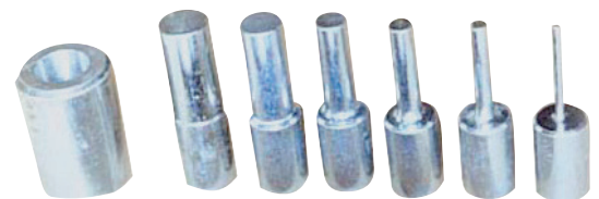
Kit de 6 poinçons