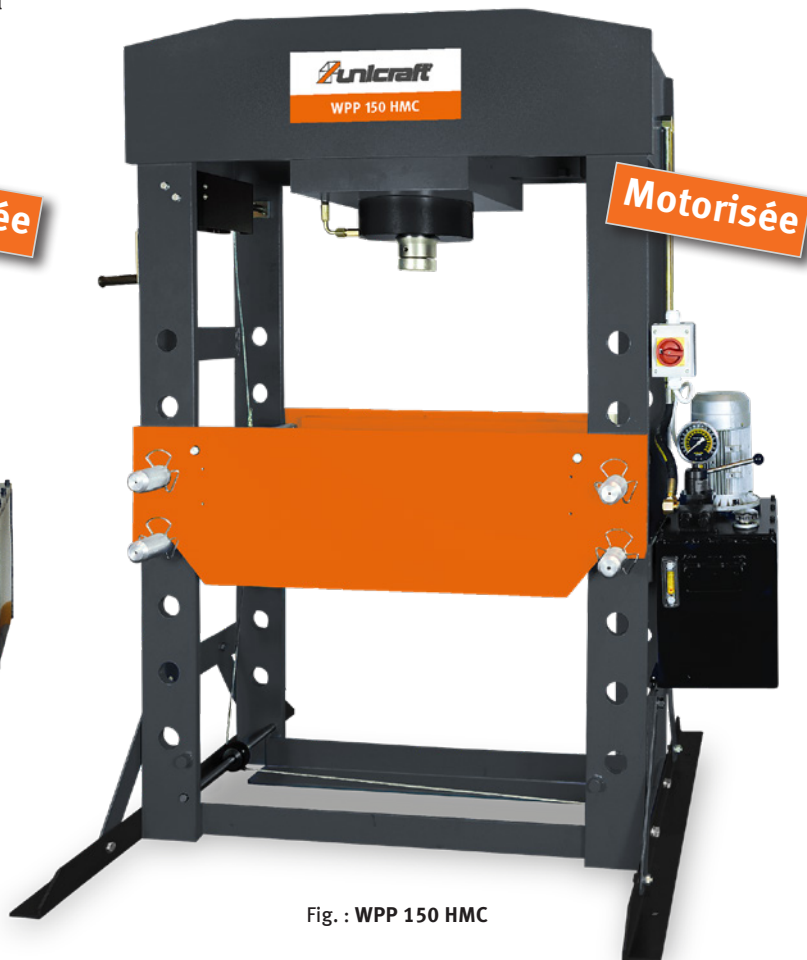
Fig. : WPP 150 HMC