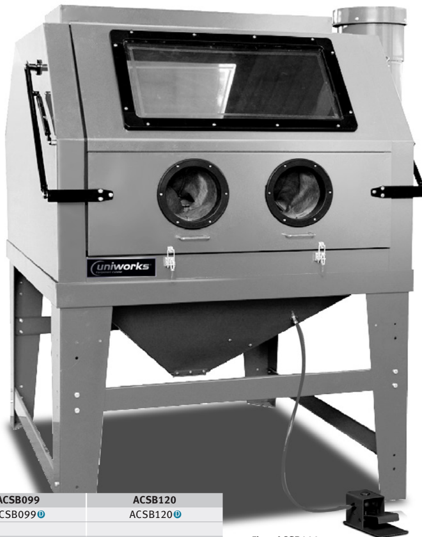
Fig. : ACSB099