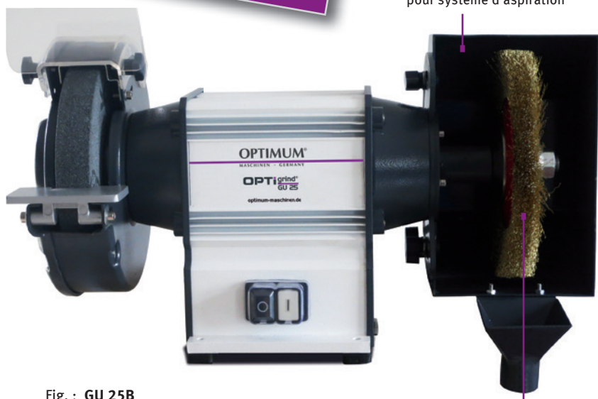
Fig. : GU 25B