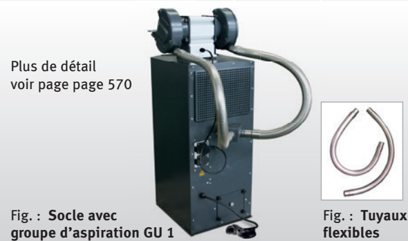
Fig. : Socle avec groupe d'aspiration GU 1