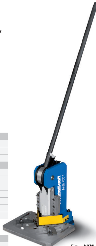
Fig. : AKM 100 T