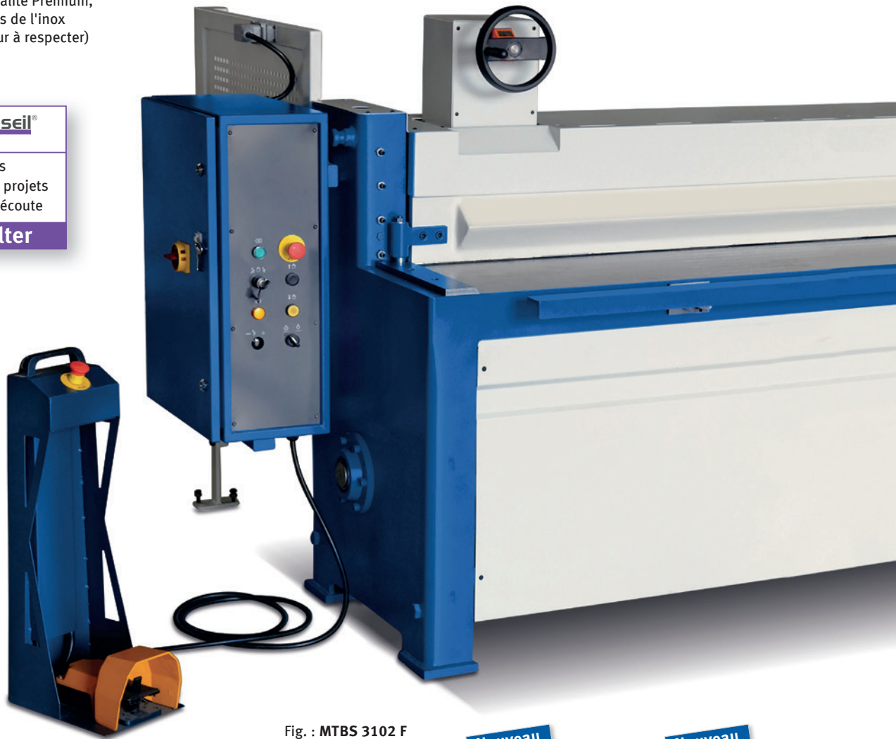
Fig. : MTBS 3102 F