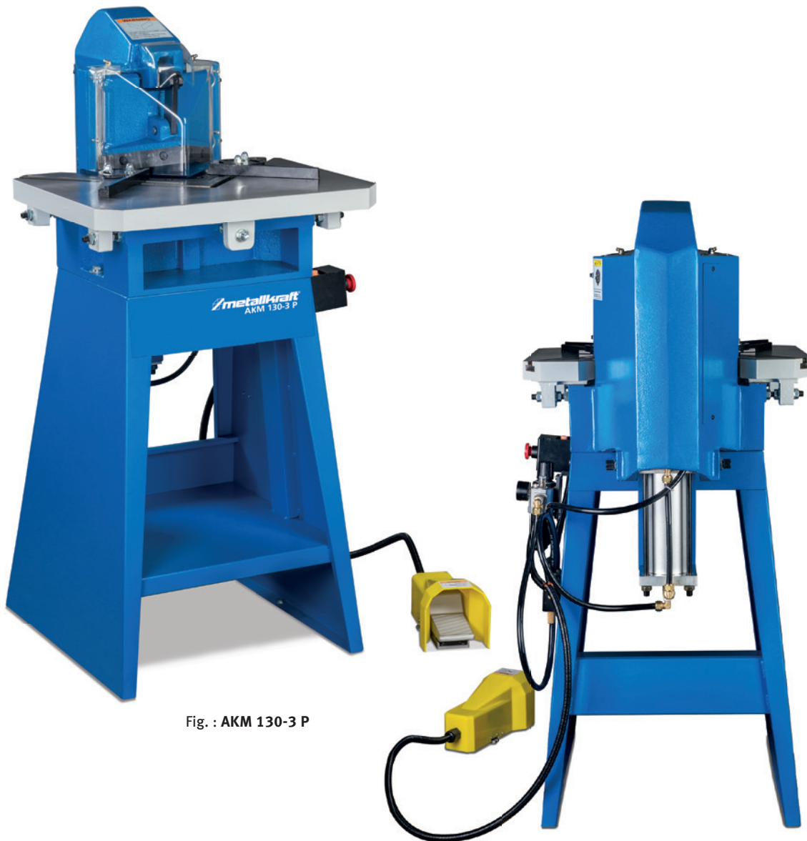
Fig. : AKM 130-3 P