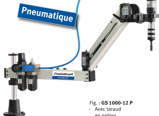
Fig. : GS 1000-12 P · Avec taraud en option