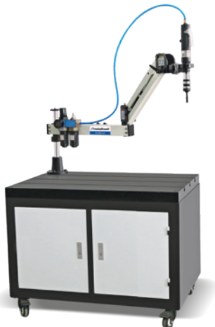
Fig. : Socle pour bras à tarauder · Avec GS 1000-12 P en option