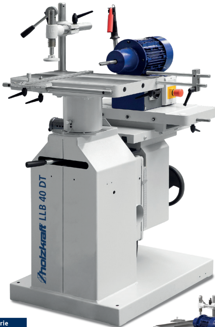
Fig. : LLB 40 DT