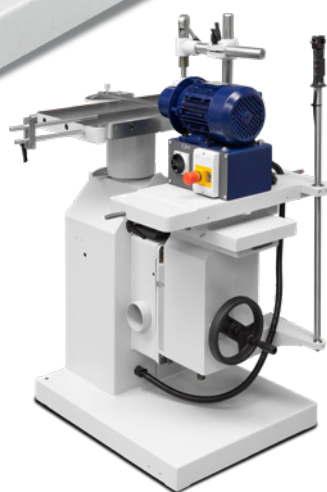
Fig. : LLB 40 DT