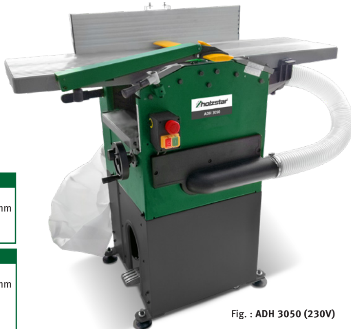
Fig. : ADH 3050 (230V)