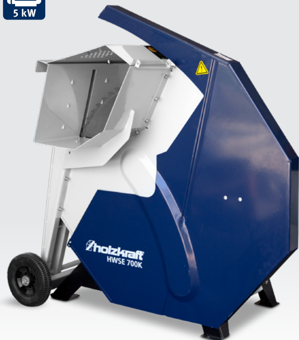
Fig. : HWSE 700 K • Vue avant