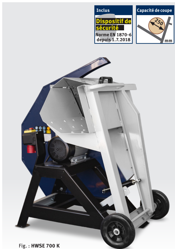
Fig. : HWSE 700 K • Vue arrière