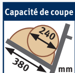
Capacité de coupe