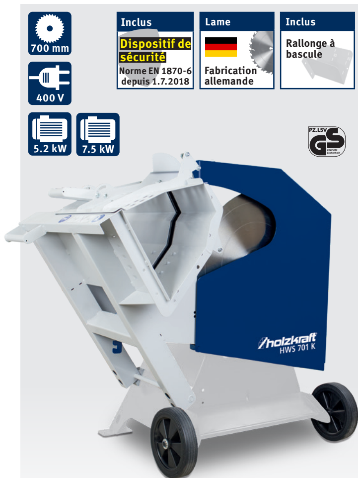
Fig. : HWS 701 K