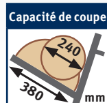
Capacité de coupe