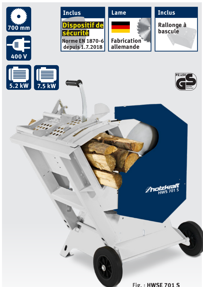
Fig. : HWS 701 S