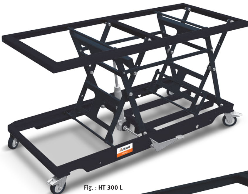
Fig. : HT 300 L