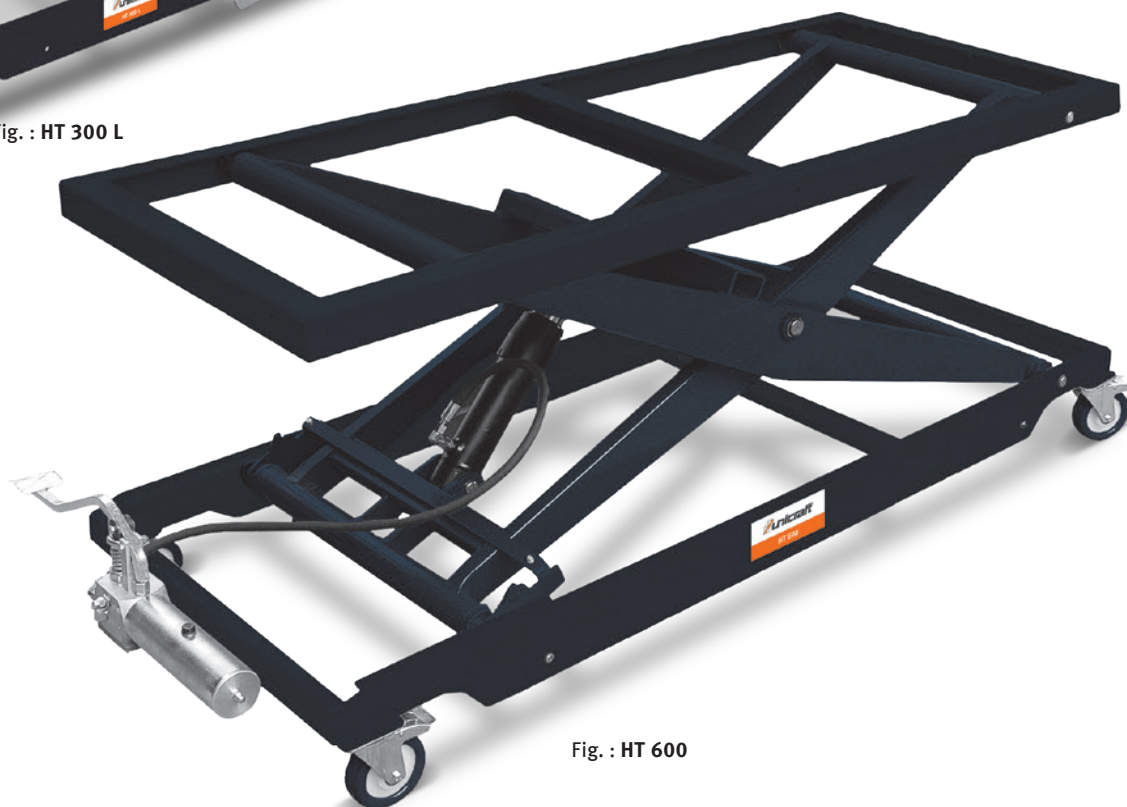
Fig. : HT 600