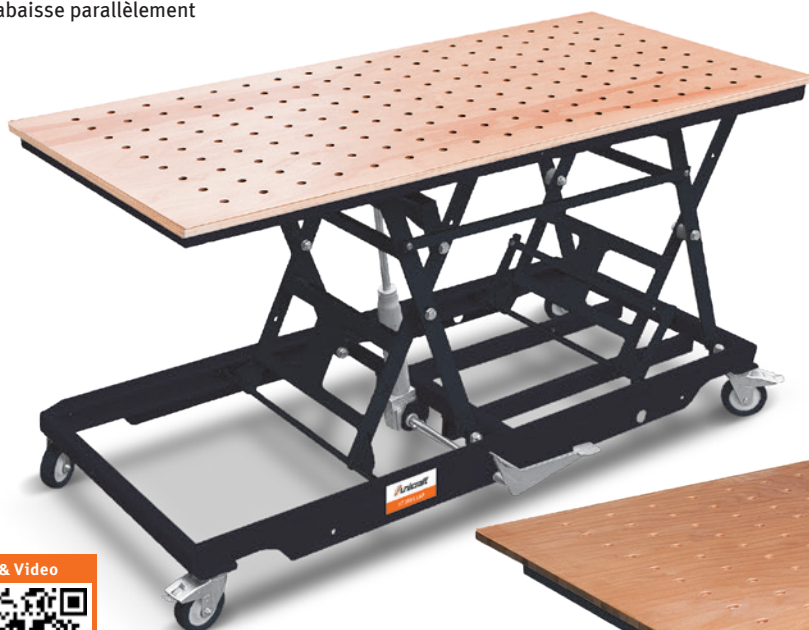
Fig. : HT 300 L LAP