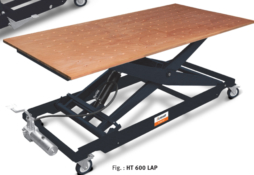
Fig. : HT 600 LAP