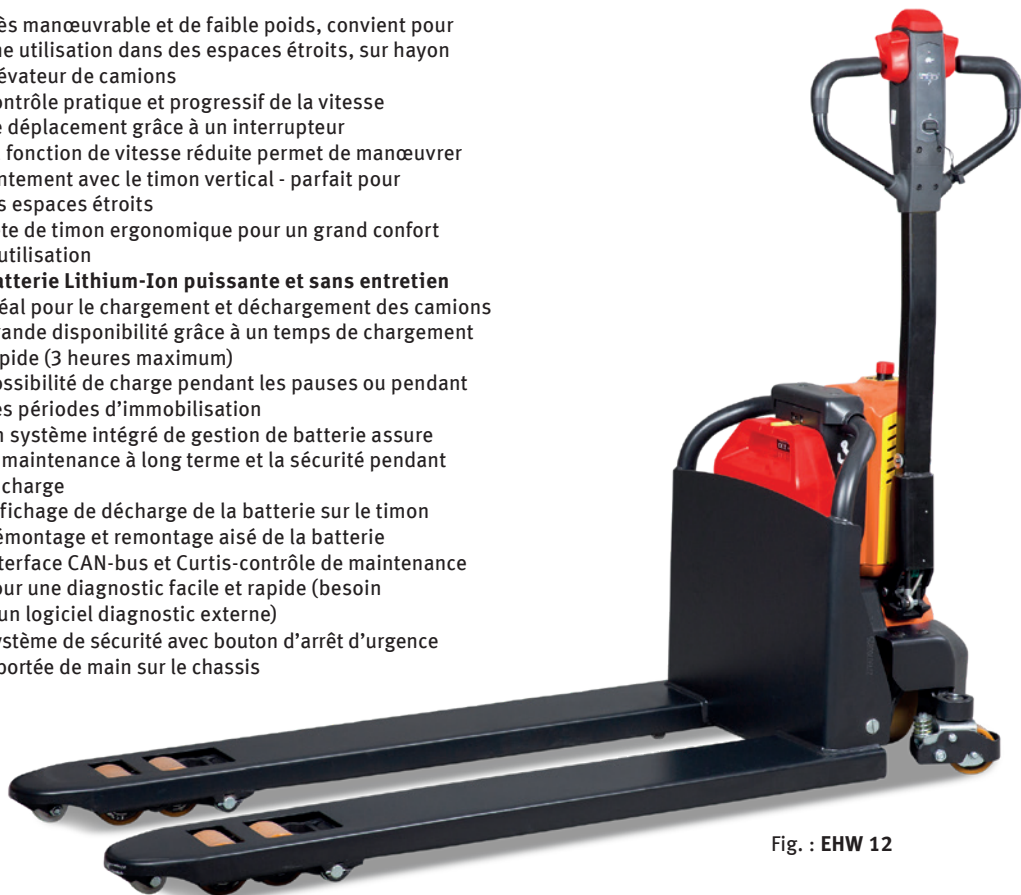
Fig. : EHW 12