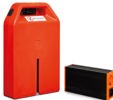
Fig. : Chargeur et batterie