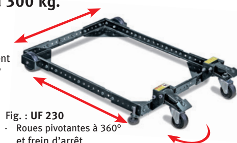
Fig. : UF 230 · Roues pivotantes à 360° et frein d'arrêt