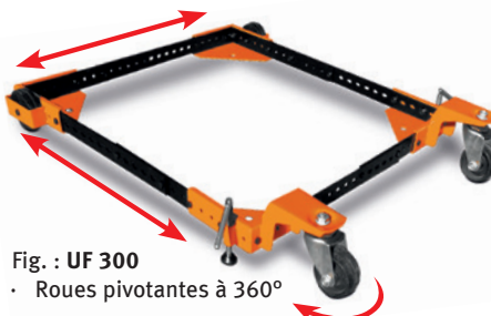
Fig. : UF 300 · Roues pivotantes à 360°