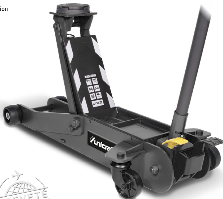
Fig. : SRWH 20 S TOP