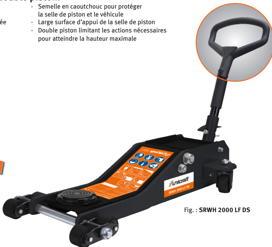
Fig. : SRWH 2000 LF DS