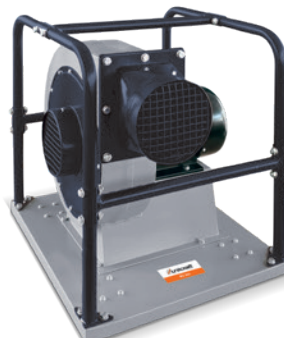
Fig. : RV 305