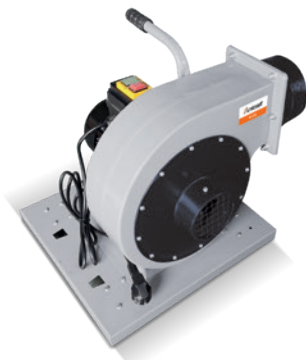
Fig. : RV 230