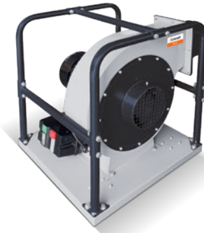
Fig. : RV 305