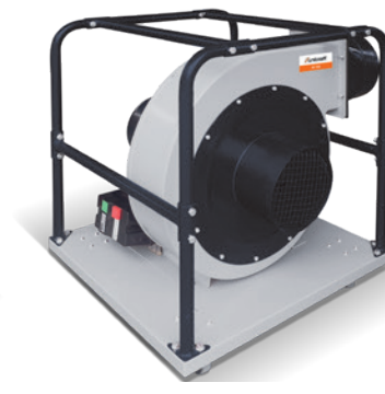
Fig. : RV 350