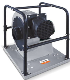
Fig. : RV 300