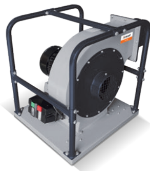
Fig. : RV 300