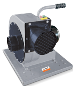
Fig. : RV 230

Modèle RV 300 / 305 / 350 • Avec cadre de protection