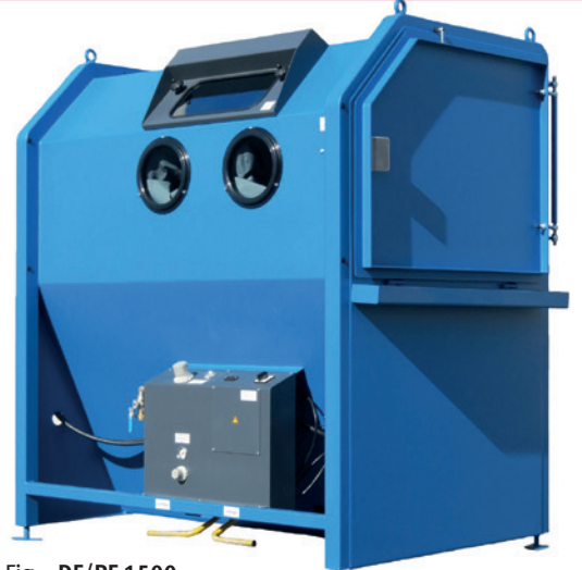
Fig. : DF/PF 1500