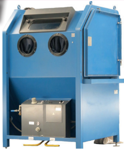
Fig. : DF/PF 1000