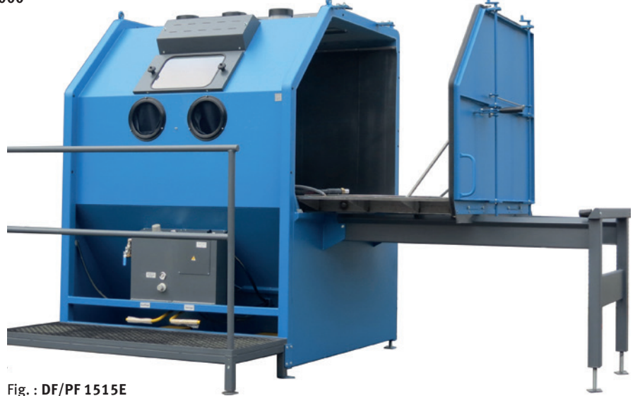
Fig. : DF/PF 1515E · Avec chariot de chargement en option