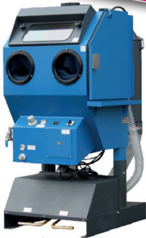
Fig. : DF/PF 700