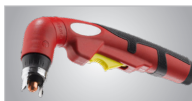
Fig. : Torche de découpage S65 6m avec raccord