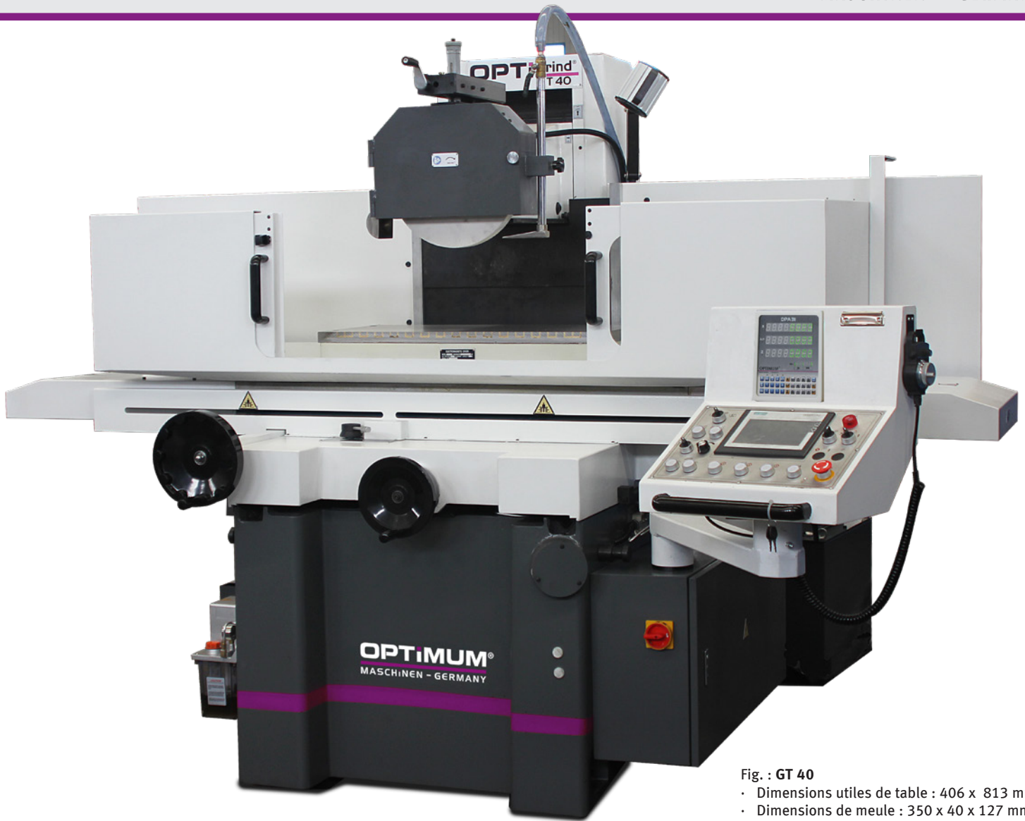
Fig. : GT 40