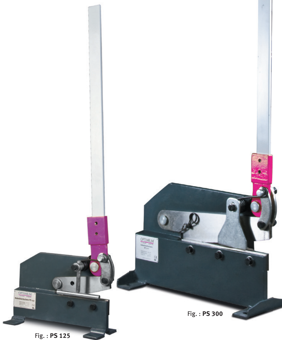
Fig. : PS 125