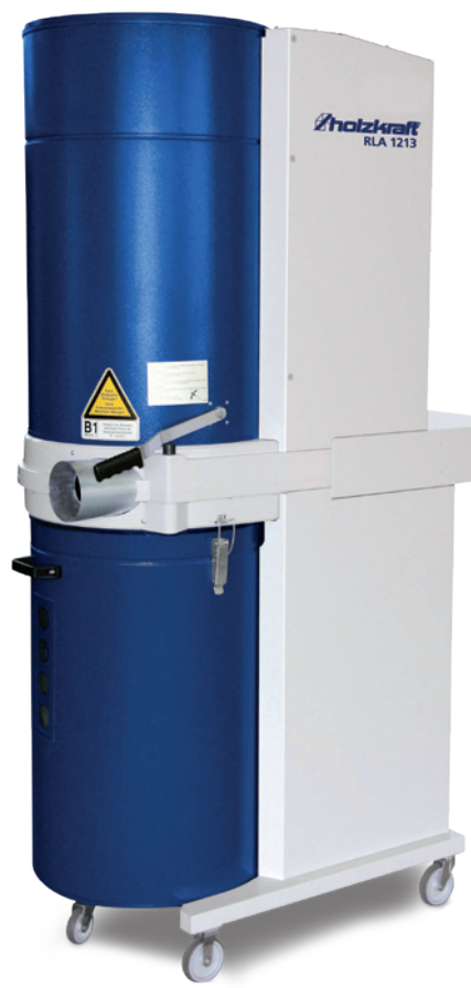
Fig. : RLA 1213w