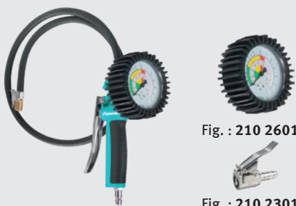
Fig. : 210 2601