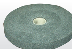
Fig. : Meule Gr 36