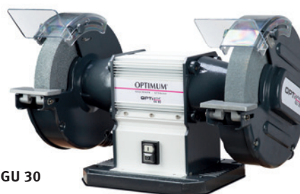
Fig. : GU 30