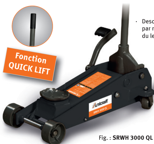
Fig. : SRWH 3000 QL