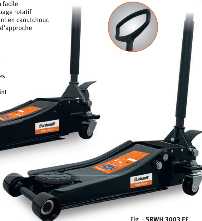
Fig. : SRWH 3003 EF