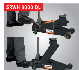
Fonction QUICK LIFT : • Permet d'accéder au point d'ancrage en une seule pression sur la pédale