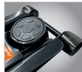
• Large selle en caoutchouc pour une parfaite stabilité du véhicule