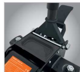
• Rangement pratique des outils grâce au compartiment prévu à cet effet