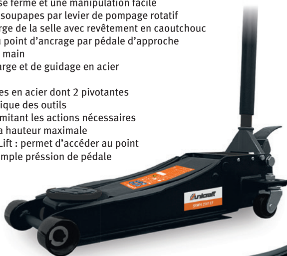
Fig. : SRWH 2501 EF