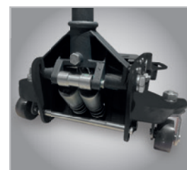
• Pompe à double piston