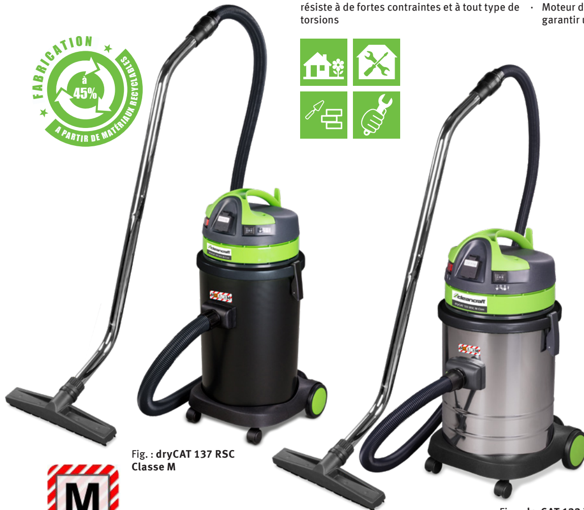
Fig. : dryCAT 137 RSC Classe M