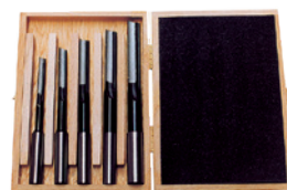
Fig. : Jeu de forets pour trous oblongs