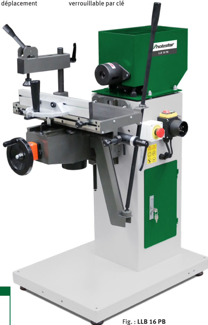
Fig. : LLB 16 PB