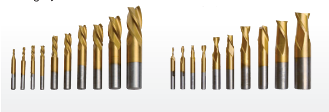
Fig. : Jeu de 20 fraises