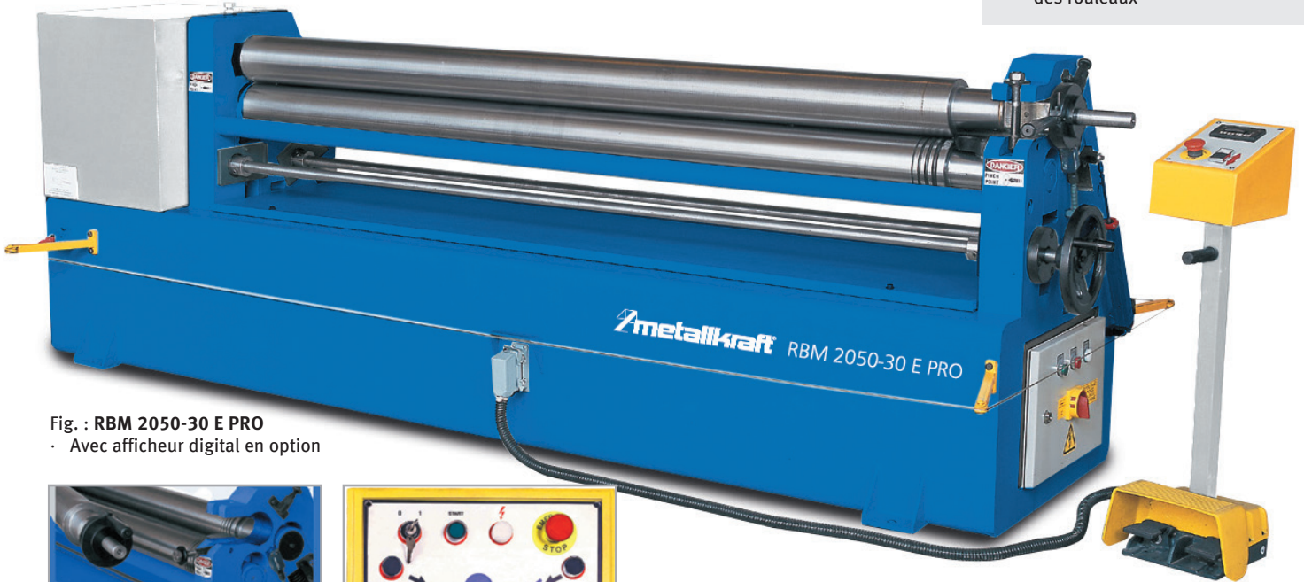
Fig. : RBM 2050-30 E PRO • Avec afficheur digital en option