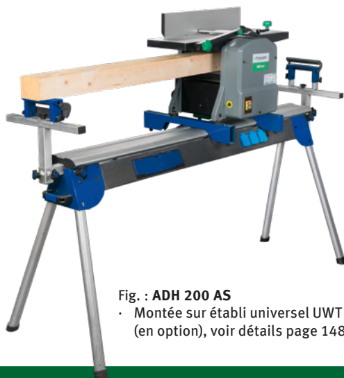
Fig. : ADH 200 AS • Montée sur établi universel UWT 3200 (en option), voir détails page 1486