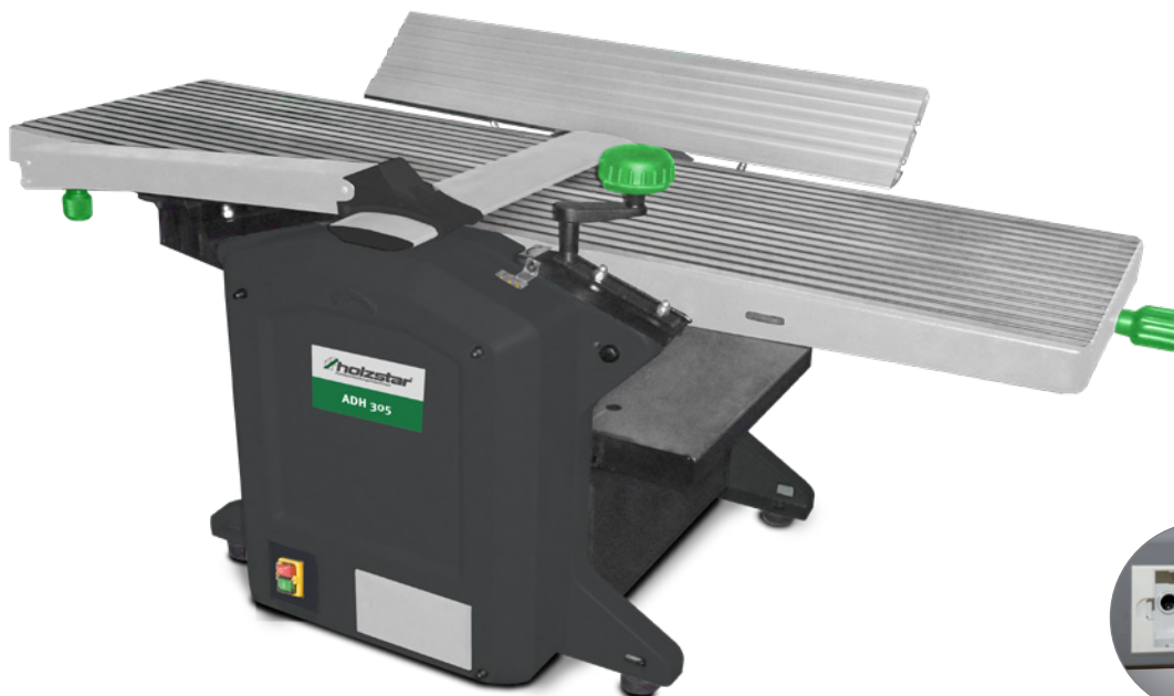
Fig. : ADH 305 • Avec compartiment de rangement intégré