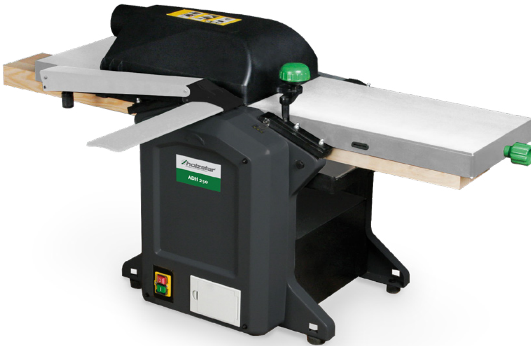
Fig. : ADH 250 • Avec compartiment de rangement intégré