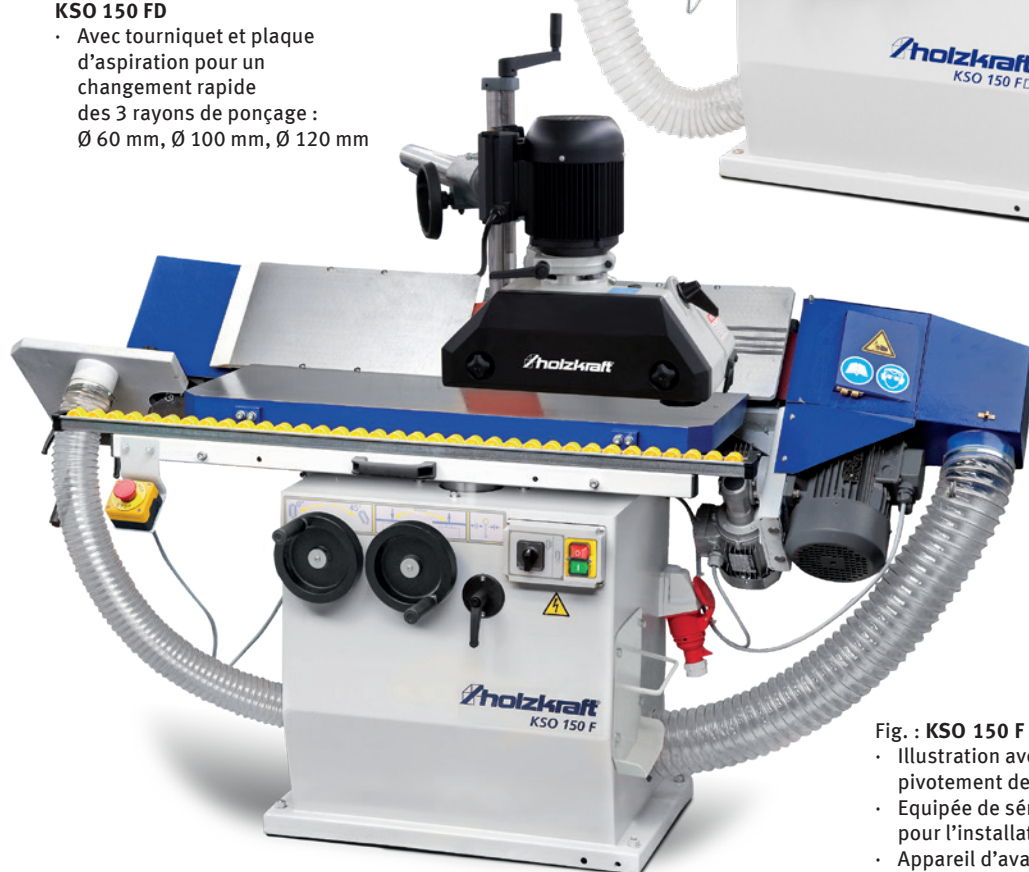
Fig. : KSO 150 F avec avance en option