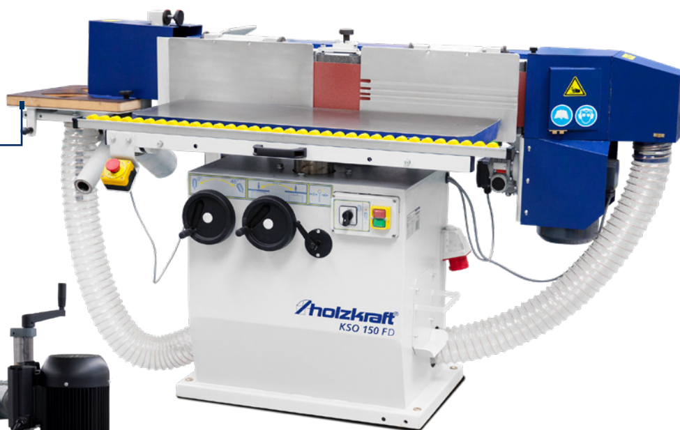
Fig. : KSO 150 FD