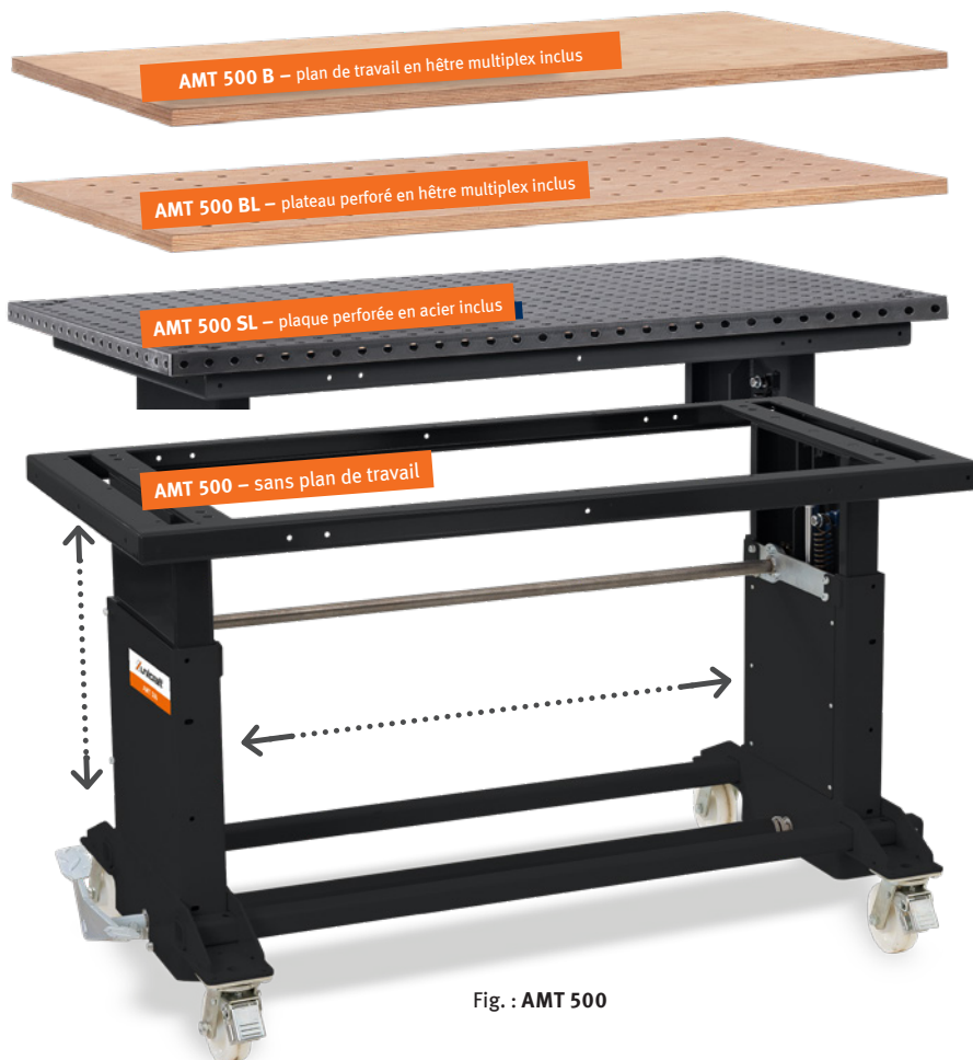
Fig. : AMT 500