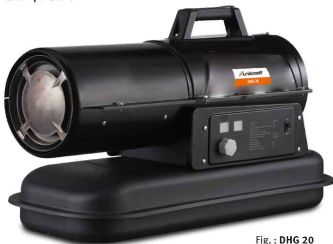
Fig. : DHG 20