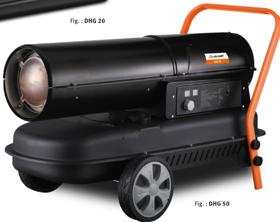
Fig. : DHG 50