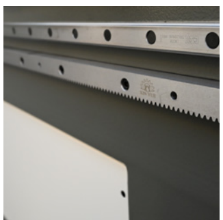
Guides linéaires • Guidage précis et de haute qualité par guides linéaires à billes