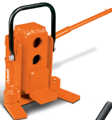
Fig. : MH 8 • 3 positions de levage de griffe