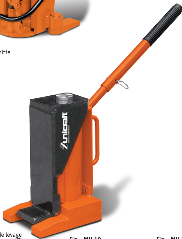
Fig. : MH 10 • 1 position de levage de griffe