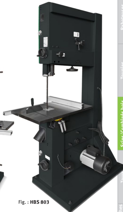
Fig. : HBS 803