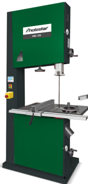
Fig. : HBS 703