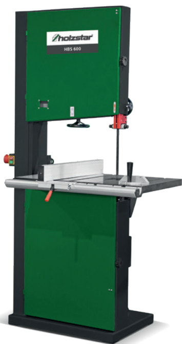
Fig. : HBS 600