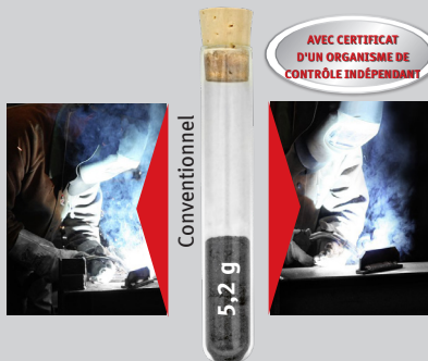
Fig. : Fumées de soudure produites par le soudage de 1 kg de fil SG