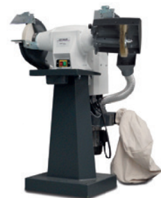
Fig. : Système d'aspiration et socle inclus sur modèles CD • Meules en option