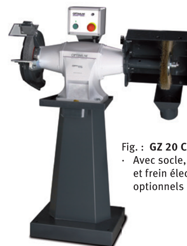
Fig. : GZ 20 C • Avec socle, meules et frein électronique optionnels