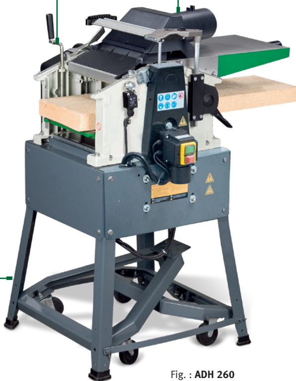
Fig. : ADH 260 converti en rabot