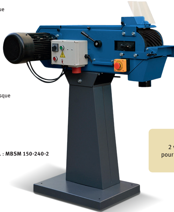
Fig. : MBSM 150-240-2

Modèles en 400 V 2 vitesses de défilement pour un usinage parfaitement adapté à la matière