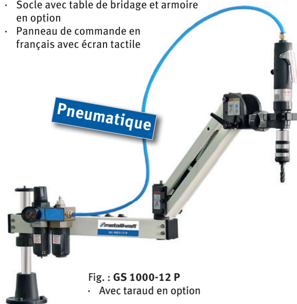
Fig. : GS 1000-12 P • Avec taraud en option