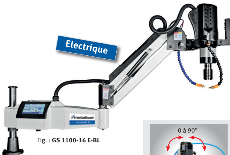
Fig. : GS 1100-16 E-BL