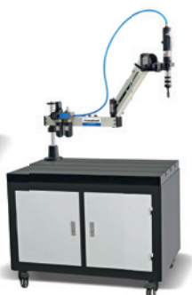
Fig. : Socle pour bras à tarauder • Avec GS 1000-12 P en option