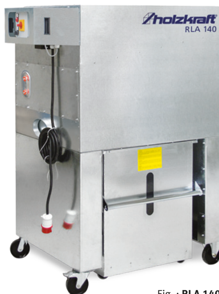
Fig. : RLA 140