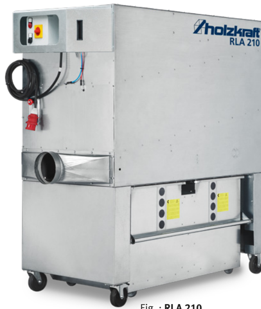
Fig. : RLA 210