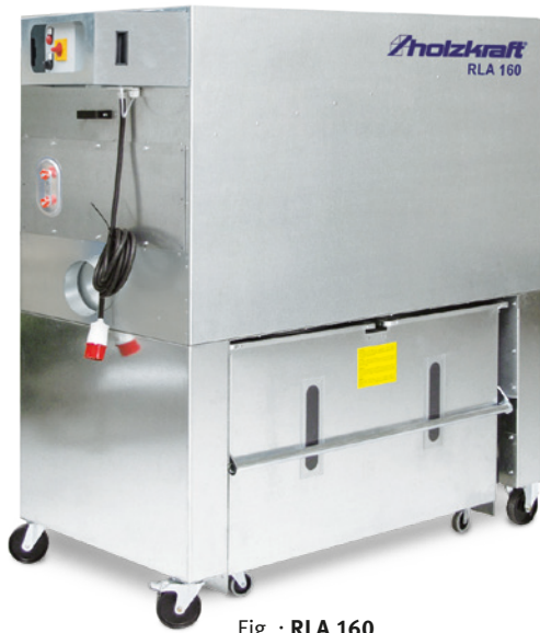
Fig. : RLA 160