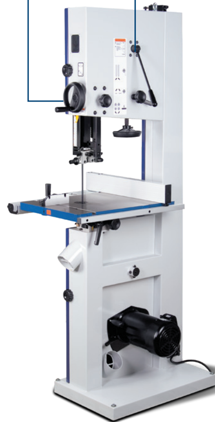
Fig.: HBS 533 • Vue arrière