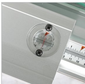
Fig. : HBS 533