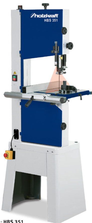
Fig. : HBS 351