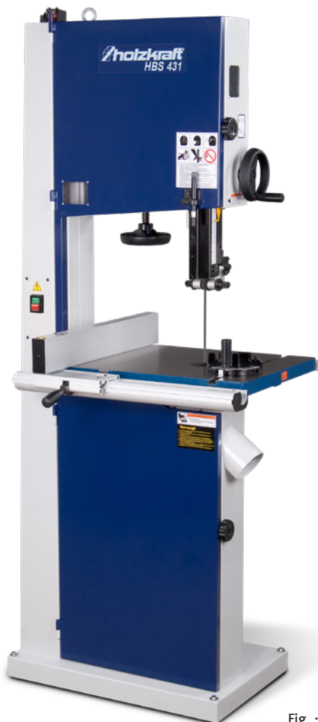
Fig. : HBS 431