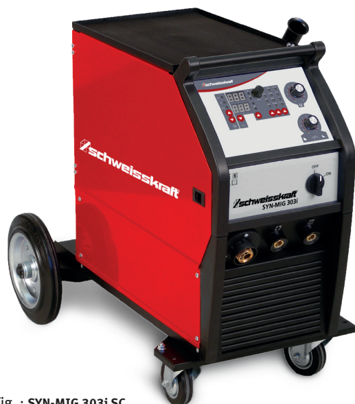
Fig. : SYN-MIG 303i SC