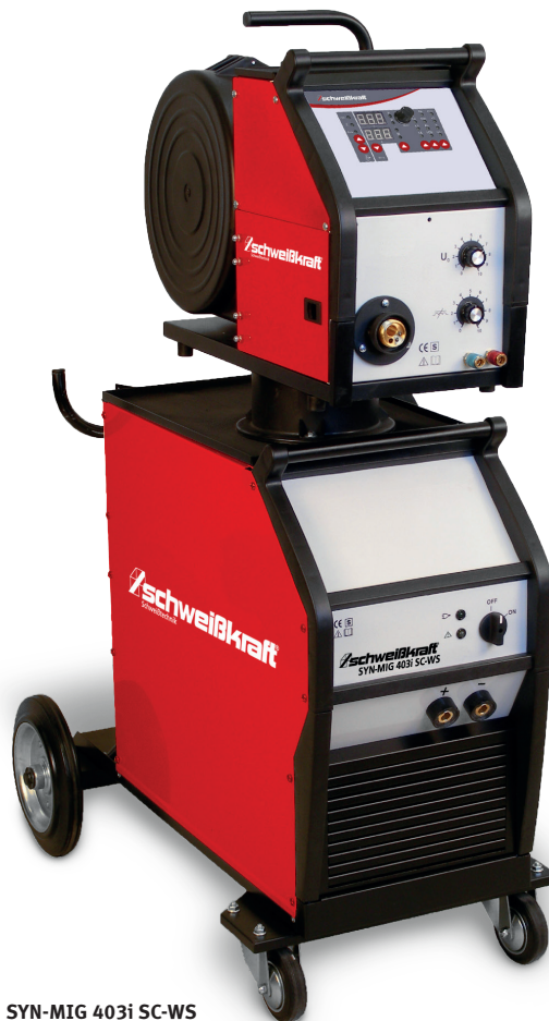
Fig. : SYN-MIG 403i SC-WS