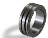
Fig. : Galet d'entraînement