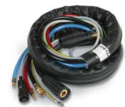
Fig. : Faisceau de tuyaux intermédiaires