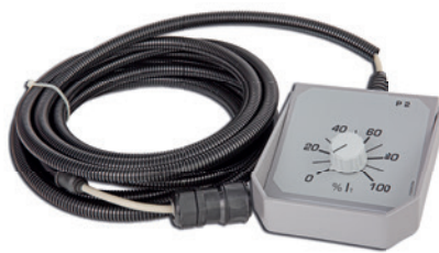
Fig. : Commande manuelle P2