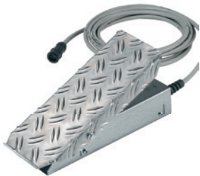
Fig. : Commande au pied