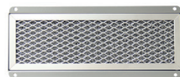
Fig. : Adaptateur de filtre à air