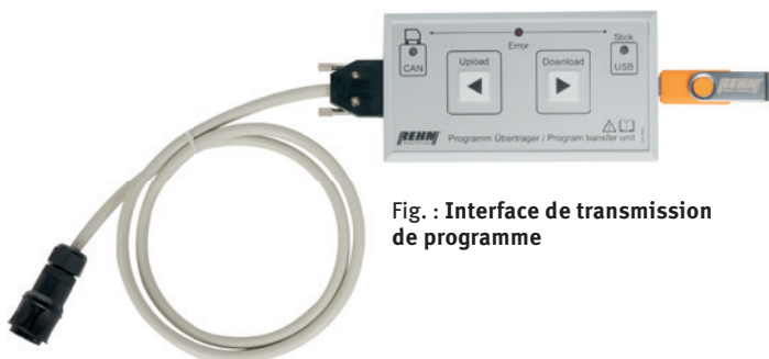
Fig. : Interface de transmission de programme