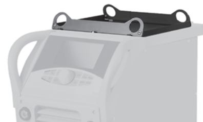
Fig. : Anneaux de levage